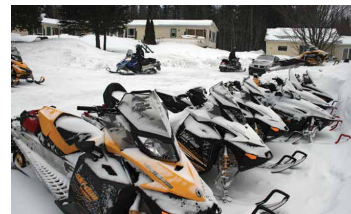
L'auberge a toujours été le rendez-vous des motoneigistes.